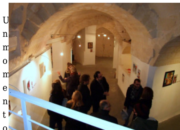
U n m o m e n t o del vernissage del 25 marzo 2016 alla Momart Gallery di Matera.

Data quindi la concomitanza con l’avvio della mostra, abbiamo deciso di dedicare questo numero di Smart Marketing proprio al mondo dell’arte. “This is tomorrow”, questo è il titolo chiaramente citazionista, che rimanda all’epocale mostra, inaugurata a Londra l’8 agosto del 1956, che consacrò la pop art e il new brutalism. Né con la mostra né tantomeno con questo numero, abbiamo l’ambizione di creare un qualcosa di simile.